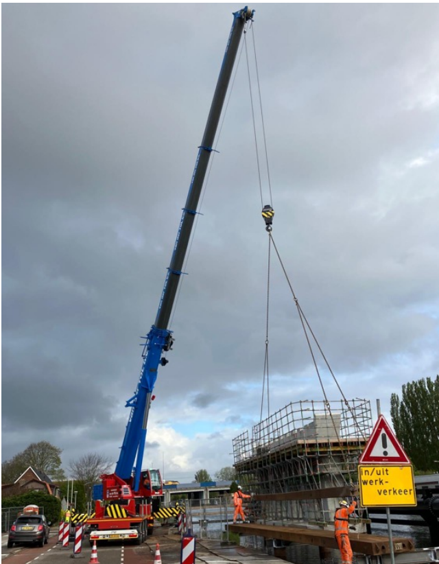
Het maken van de tijdelijke constructies voor de hijskranen