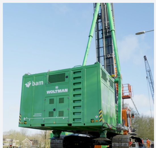
De 100% elektrische machine die de funderingspalen de grond in boort