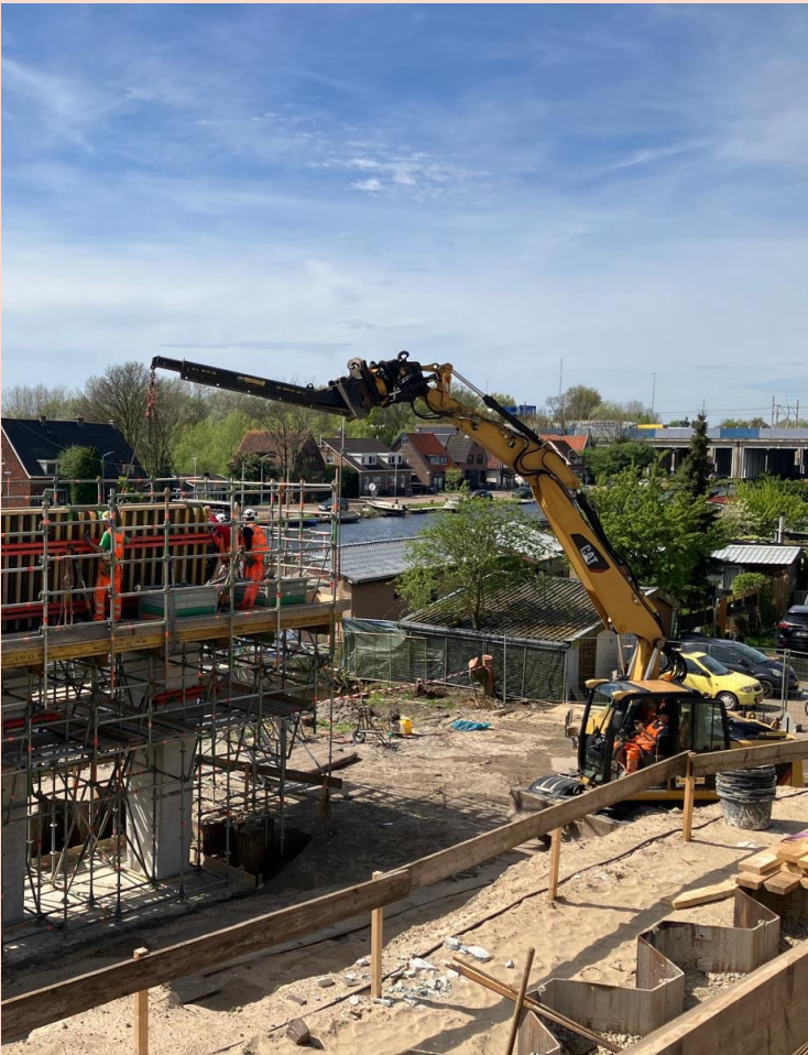
Het maken van de onderslagbalken aan de Oude Haagseweg in Amsterdam