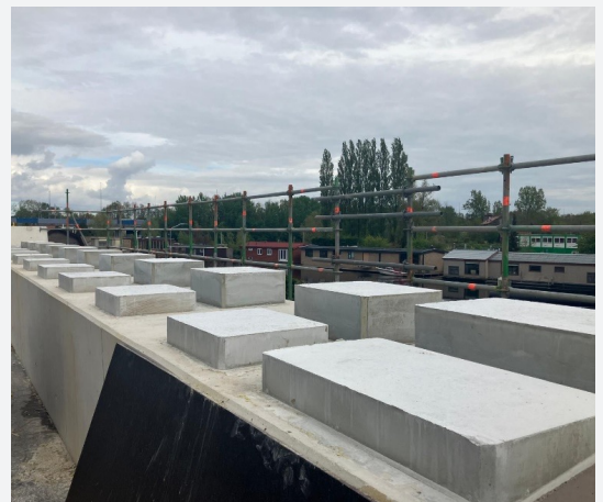
De opstorten op de onderslagbalken. Hier leggen we in mei en juni de brugliggers op

Op woensdag 29 mei vindt de roeiwedstrijd de Ringvaart Regatta plaats. Tussen 09.00 uur en 13.00 uur varen er over de Ringvaart veel roeiboten. Om de boten doorgang te geven, is de pontonbrug deze ochtend niet toegankelijk voor fietsers en voetgangers. Wij vertrouwen op uw begrip hiervoor!